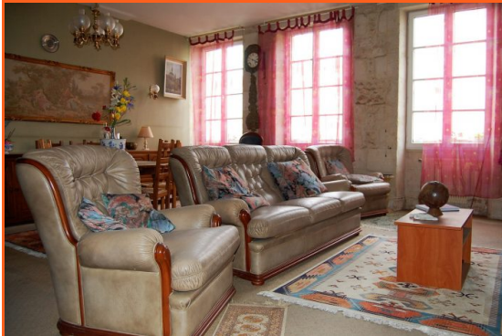
local commercial Rdc